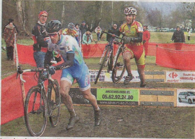
Les planches étaient l'un des obstacles du circuit de Lau-Balagnas.