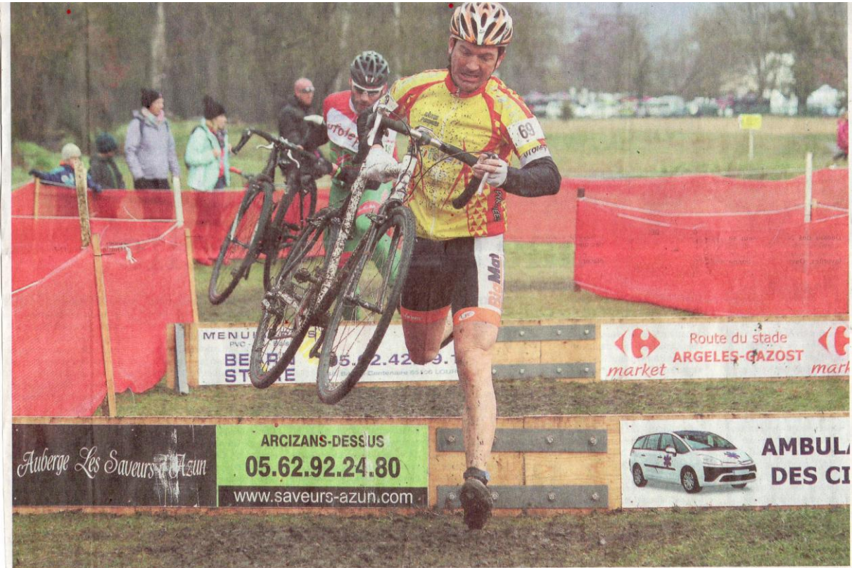
Lors du championnat de France de cyclo-cross Ufolep, les coureurs licenciés dans les Hautes-Pyrénées ont assuré sur le parcours de Lau-Balagnas, qu'ils connaissent si bien.