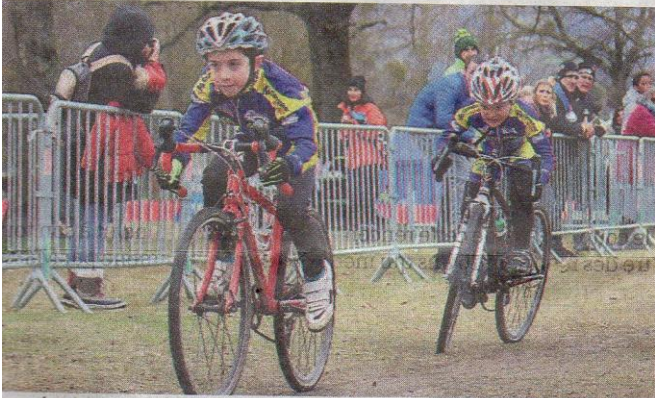
Les plus jeunes ont également tout donné pour la victoire.