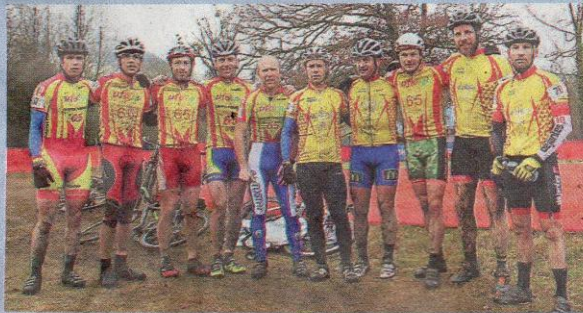
Les coureurs haut-pyrénéens, 1 er par équipes chez les 40-49 ans.