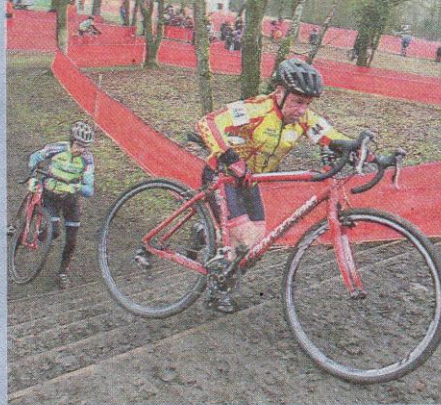
Les compétiteurs ont dû quitter leur selle pour grimper les marches du parcours.