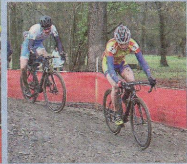
Dans certains secteurs, le terrain était relativement boueux et glissant.