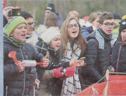
Les spectateurs ont encouragé les coureurs tout le week-end.