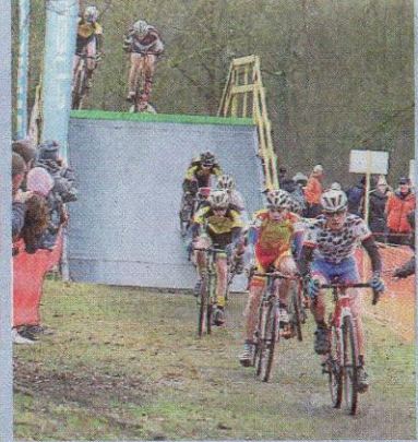
La passerelle, obstacle très physique pour les coureurs.